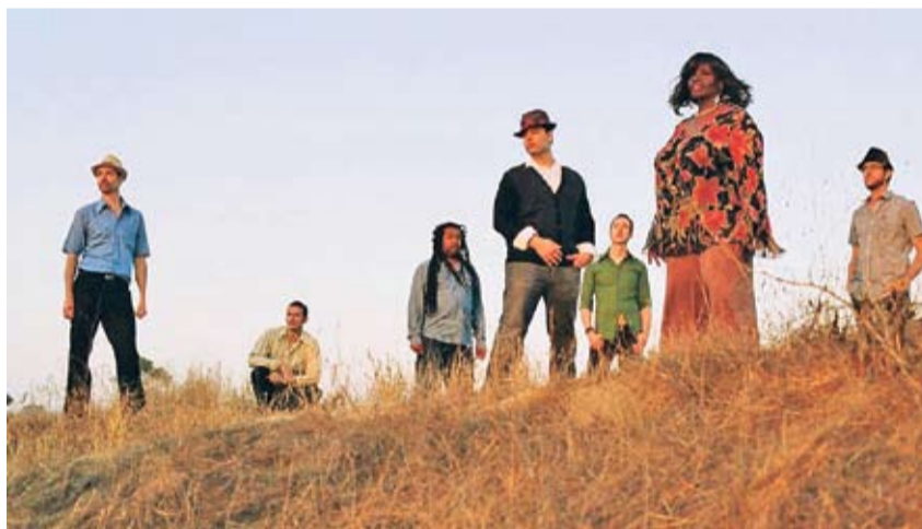
Groovig. Die kalifornische Funkband Breakestra macht halt in der Kaserne.

> Kaserne, Rosstall 1, Klybeckstrasse 1b, Basel, Sa, 23 Uhr. www.kaserne-basel.ch